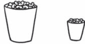
The big cup holds more than the small cup. The small cup holds less than the big cup.