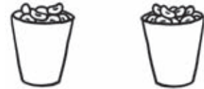
Both cups hold the same amount .